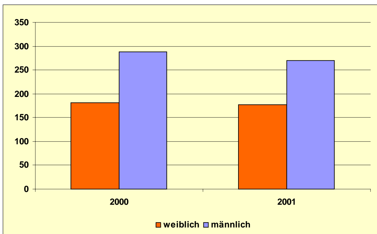
Diagramm 1: Eingebürgerte Frauen und Männer, 2000 u. 2001